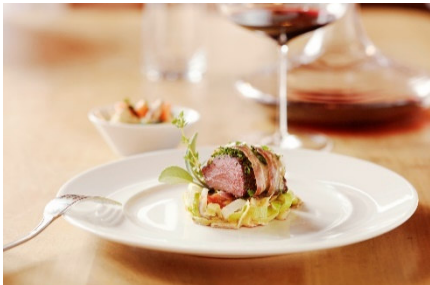
Hauptgang im Schlüssel