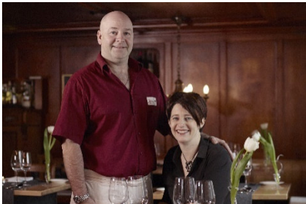
Gastgeberpaar im Boutique-Hotel Schlüssel