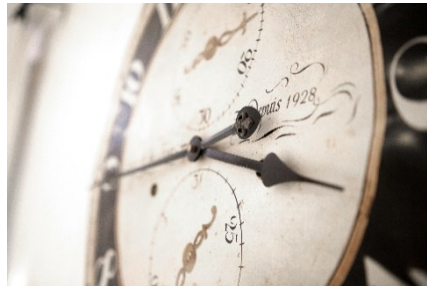
Viel Liebe zum Detail