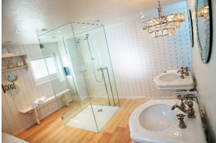
Boutique-Zimmer Deluxe mit freistehender Dusche