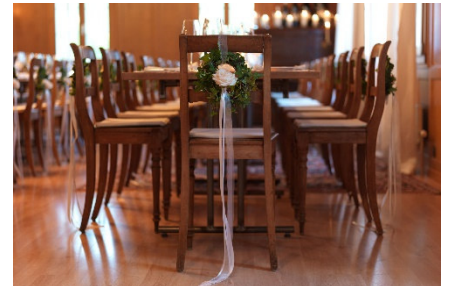
Hochzeit in der Weinstube