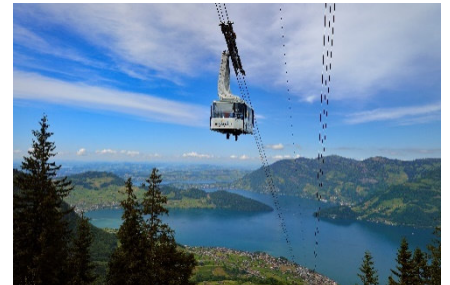
Ausflug auf die Klewenalp